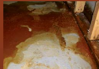
Dépôts rougeâtres sur la dalle de béton des sous-sols