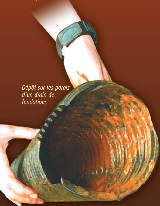
Dépôt sur les parois d'un drain de fondations

1. Nappe d'eau souterraine avec ou sans écoulement extérieur.