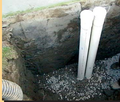
Installation type de cheminées de nettoyage